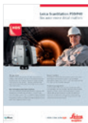
Leica ScanStation P30/40

Abbildungen, Beschreibungen und technische Daten sind nicht verbindlich. Änderungen vorbehalten. Gedruckt in der Schweiz – Copyright Leica Geosystems AG, Heerbrugg, Schweiz, 2015. 835468de – 03.15 – INT