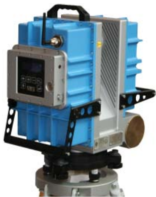
Explosionssgeschützt: IMAGER 5006EX

Upgrades auf die 5006i- und 5006h-Version folgten in den Jahren 2008 bzw. 2010. Mit einer Datenerfassungsrate von 1.016.027 Pixel/s wurde der Z+F IMAGER 5006h das schnellste 3D-Lasermessgerät weltweit. Neben dem Z+F IMAGER für 3D-Laserscanning wurden noch weitere Geräte wie der Z+F PROFILER entwickelt. Das 2D-Lasermessgerät ist ebenfalls seit 2002 auf dem Markt und für kinematische Anwendungen bestens geeignet. Z+F PROFILER werden häufig für Bahnanwendungen oder auf Fahrzeugen eingesetzt. Die Entwicklungsstufen des PROFILERS sind mit dem Z+F IMAGER identisch.