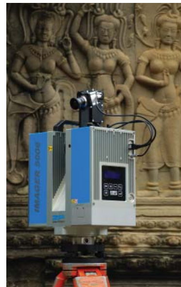
Einsatz in Angkor Wat: Z+F IMAGER 5006i

Mit Niederlassungen in England und den USA sowie zahlreichen Vertriebskooperationen weltweit ist Zoller + Fröhlich heute in über 40 Ländern vertreten. Erstklassiger Service und persönliche Beratung sind wesentliche Komponenten für den Erfolg von Zoller + Fröhlich.