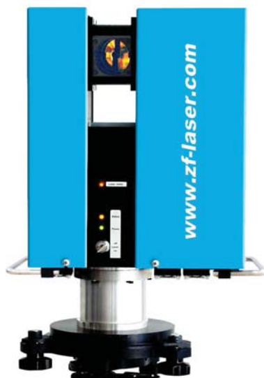
Das erste kompakte Seriengerät: Z+F IMAGER 5003

Mit dem Z+F IMAGER 5006 gelang es 2006 den Erfolg der IMAGER-Serie weiter zu steigern. Dank des integrierten Bedienfeldes, eines leistungsfähigen internen PC's, einer Festplatte und der internen Batterie war es das erste 3D-Lasermessgerät, bei dem das Stand-Alone-Konzept zu 100% umgesetzt wurde.